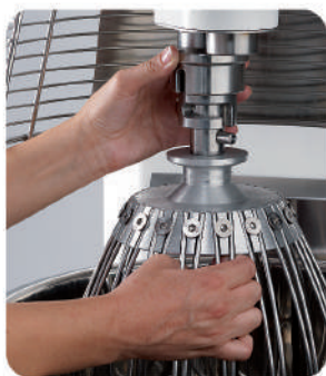
BT40-60-80 Aggancio utensile / Tool hooking system Accrochage outil / Enganche de utensilio Halterung für Arbeitsgeräte