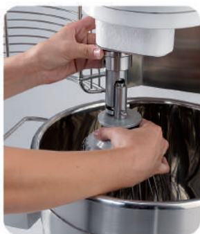
BT12B/20B Aggancio utensile / Tool hooking system Accrochage outil / Enganche de utensilio Halterung für Arbeitsgeräte