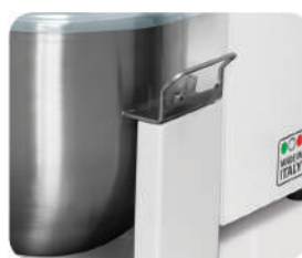
BT12B/20B Bloccaggio automatico vasca / Bowl automatic locking / Blocage automatique cuve / Bloqueo automático de perol Automatisches Einrasten des Kessels