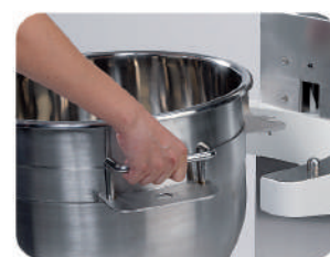
BT40-60-80 Bloccaggio automatico vasca / Bowl automatic locking / Blocage automatique cuve / Bloqueo automático de perol Automatisches Einrasten des Kessels