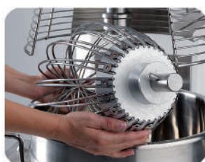
Estrazione utensile senza togliere la vasca Tool removal without bowl removal Extraction outil sans enlever la cuve Extracción del utensilio sin quitar la perol Herausnahme des Arbeitsgeräts ohne Entfernung des Kessels