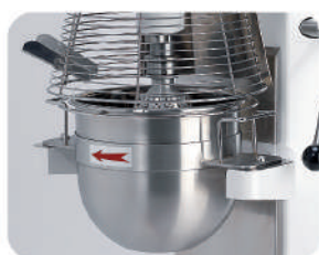
Riduzione vasca / Bowl reduction system Réduction cuve / Reducción de perol Reduzierring für kleinere Kessel